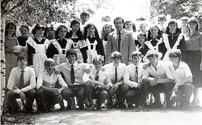
Перший випуск (1982 р.)