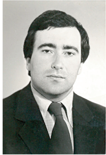
Переможець конкурсу «Вчитель року» (1987 р.)