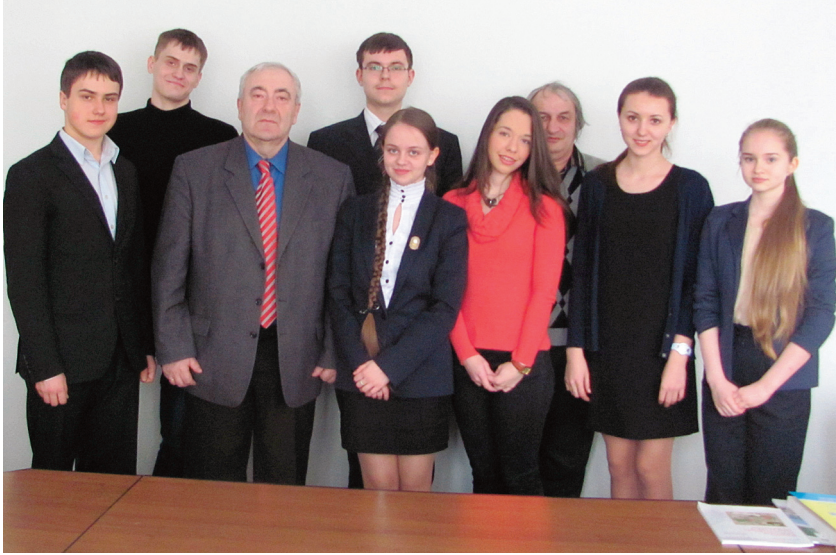
З командою юних істориків м. Києва. Переможці Всеукраїнської олімпіади з історії (березень 2013 р.)