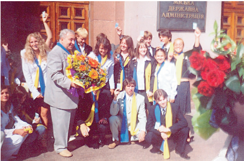
Зі студентами соціально-гуманітарного факультету (2005 р.)