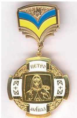
Нагрудний знак «Петро Могила» (2008)

Почесне звання «Заслужений працівник культури України» (2011).