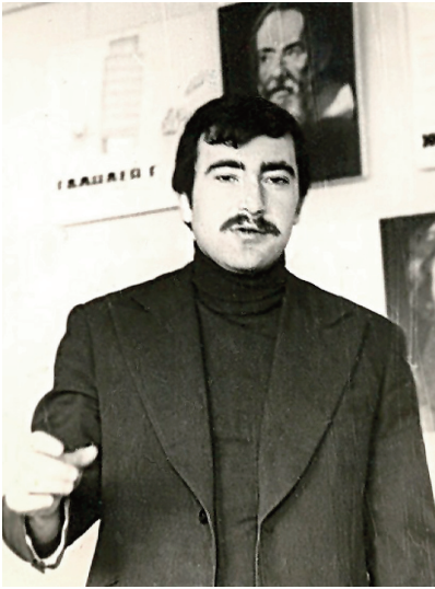
Перший урок історії (1978 р.)