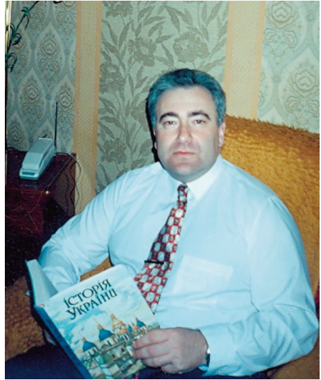
Підготовка до лекцій