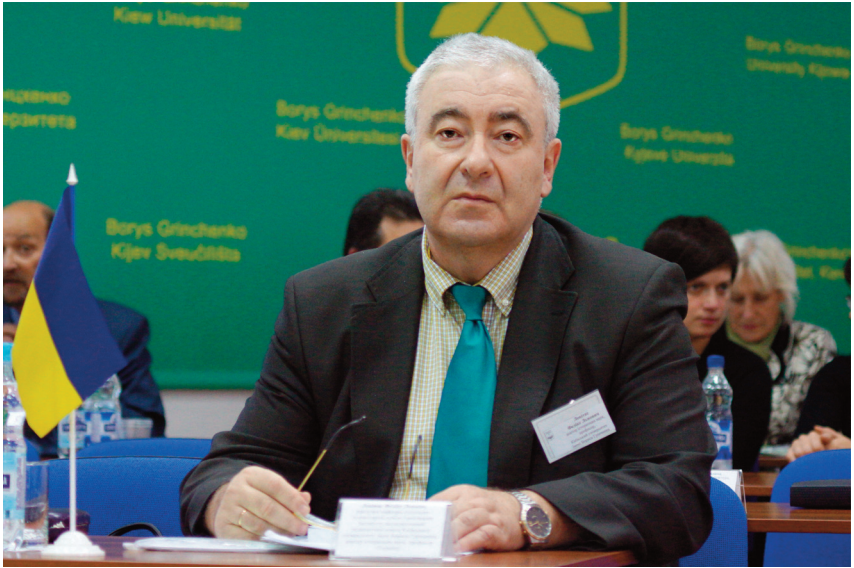
Робочий момент міжнародної конференції (жовтень, 2012 р.)