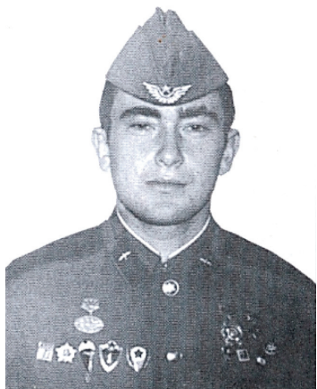
За 100 днів до «Наказу...»