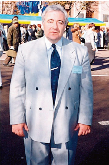
Декан соціально-гуманітарного факультету КМПУ імені Б.Г. Грінченка (2005 р.)