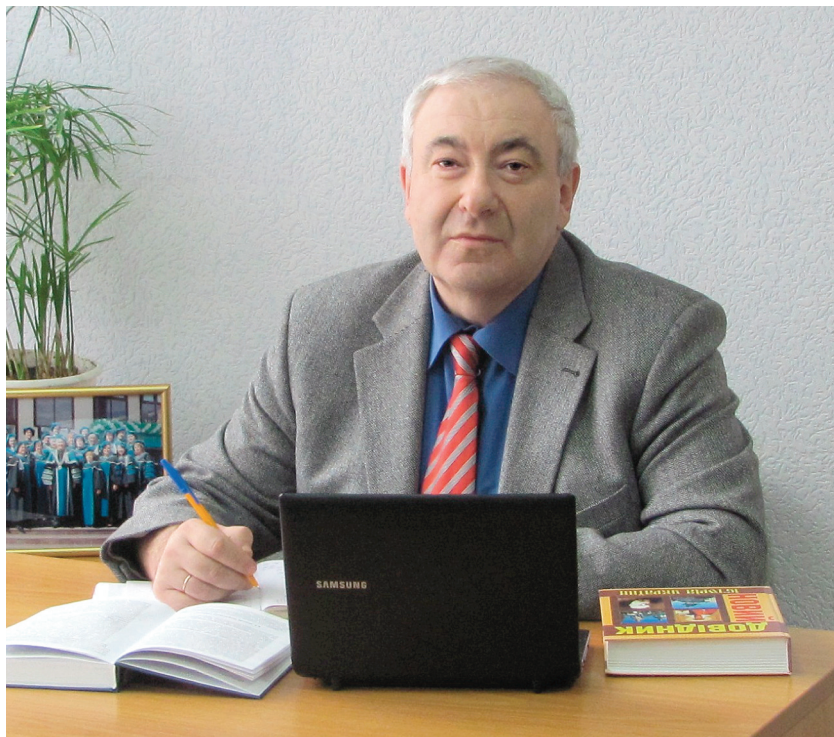
Фелікс Львович Левітас, завідувач кафедри методики суспільно-гуманітарної освіти та виховання Інституту післядипломної педагогічної освіти Київського університету імені Бориса Грінченка, доктор історичних наук, професор, Відмінник освіти України, Заслужений працівник культури України