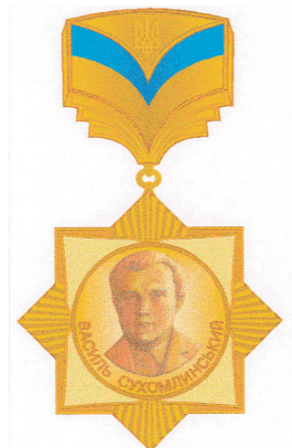
Нагрудний знак «Василь Сухомлинський» (2011)