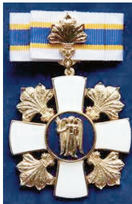
Знак пошани КМДА (2011)